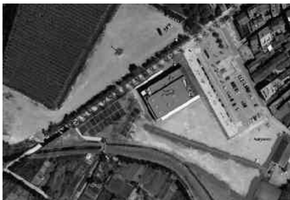
L'adequació de l'entorn de l'Espai Ter serà un dels projectes sobre els quals es demanarà l'opinió a la població.

El mes d'abril iniciarem un procés de consulta sobre sis actuacions de diferents àmbits i tipologia. Volem conèixer la vostra opinió per decidir com orientar-los. El procés és fruit de l'acord entre el govern i els grups municipals a l'oposició.